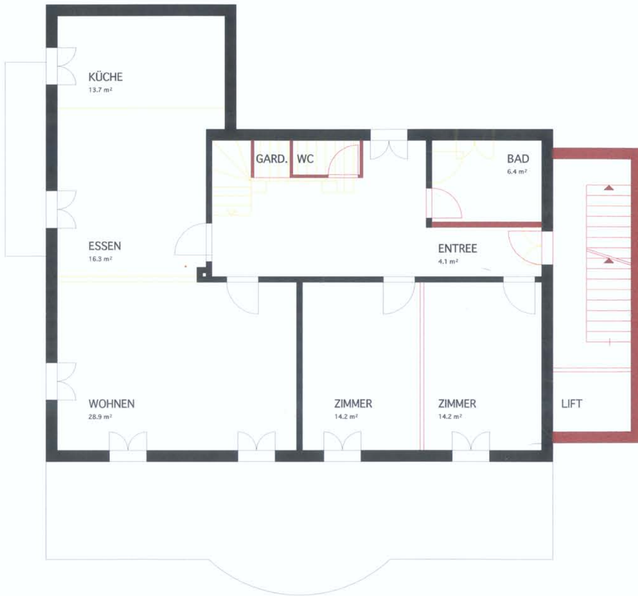
ERDGESCHOSS + OBERGESCHOSS